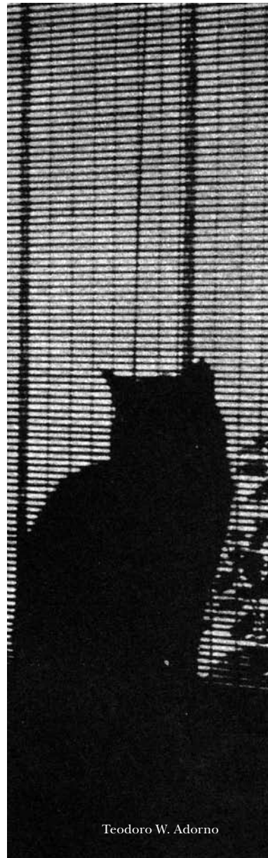
Teodoro W. Adorno

A minha querida María Zambrano, que defende amorosamente as diversas manifestações de Aracne, perdoar-me-á se eu disser que esta tarde apliquei um sapato e setenta e cinco quilos de peso sobre uma aranha negra que mirava subir pelas minhas calças, manobra com a qual consegui desencorajá-la notoriamente. É óbvio que os restos da aranha já se juntaram aos alimentos destinados ao bispo de Evreux, que se vão amontoando num canto da gaiola onde a ponta de uma vela permite distinguir pedaços de cordel, beatas de Gauloises , flores secas, caracóis, e outro monte enorme de ingredientes que mereceriam a aprovação do pintor Alberto Gironella, ainda que a gaiola e o bispo lhe parecessem puro trabalho de amador. Seja como for não vou poder pendurar a gaiola na sala; tal como a nuvem sobre Cazeneuve, ficará inquietamente suspensa sobre a minha mesa de trabalho. Já prendi o bispo: com duas chaves inglesas, apertei a corda em ferro que lhe cinge o pescoço, deixando-lhe apenas um ponto de apoio para o pé direito. A corrente que sustém a gaiola chia cada vez que se abre a porta do meu