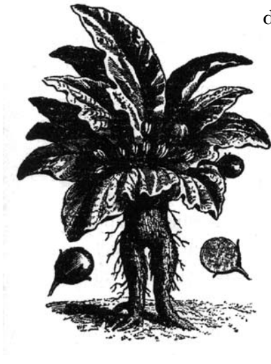
☞ La Mandragore , Flammarion, Paris, cap. III.

degradou até se tornar num conto de Grimm, o do adolescente virgem injustamente enforcado aos pés do qual nasce a mandrágora; porém esse adolescente é o Cristo, e o seu fruto involuntário preenche o folclore à falta de melhor descendência.